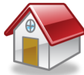
駅前送迎所 こうのとりの家